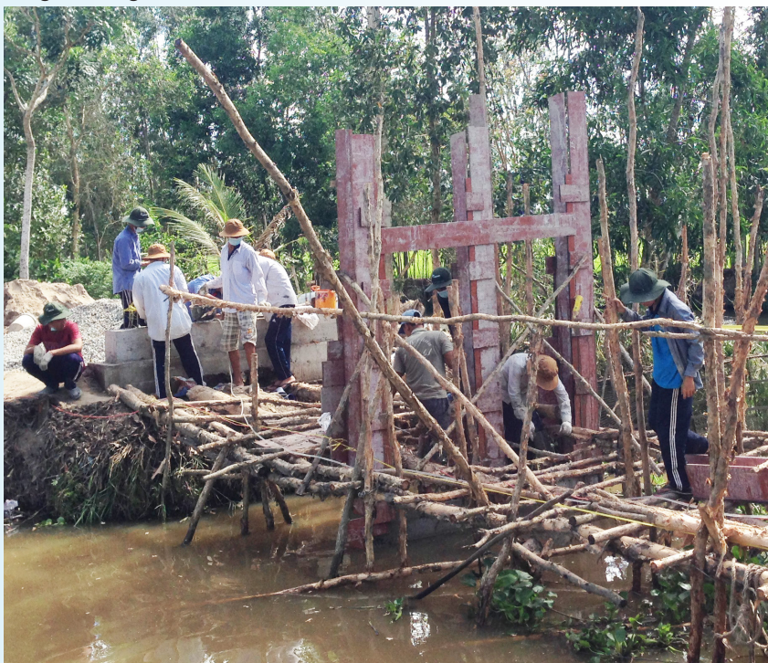
Sinh viên Trường ĐHCT tham gia xây cầu tình nguyện.

Thấm thoát mà những ngày hè sôi động đã trôi qua. Dấu chân tình nguyện “ Thanh niên Đại học Cần Thơ ” đã in đậm trên những đường quê thân thuộc. Những tình cảm và hình ảnh đẹp về sinh viên Trường ĐHCT còn đọng lại sâu sắc trong lòng người dân vùng ĐBSCL mộc mạc chân chất. Những giọt mồ hôi đã rơi trong những trưa hè nắng gắt hay những khi ướt sũng vì những cơn mưa rào mùa hạ... đâu đó như mới đây thôi. Những hương vị cuộc sống đầy ý nghĩa này đã trở thành những kỷ niệm đẹp tiếp thêm sức mạnh và động lực cho sinh viên Trường ĐHCT trở lại giảng đường học tốt và hứa hẹn sẽ trở về những vùng đất thân thương trong mùa hè tới.