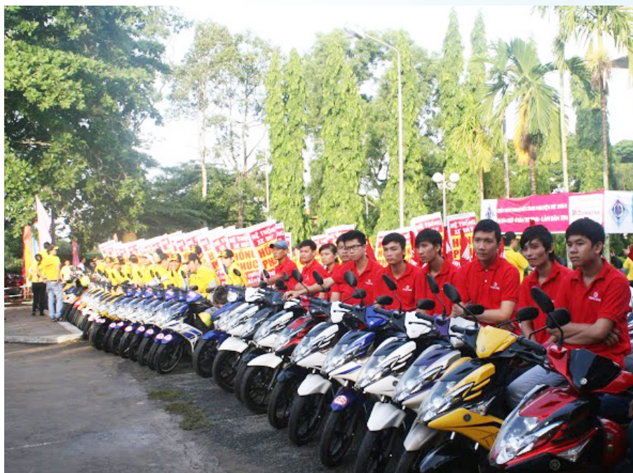
Đội xe ôm của sinh viên Trường ĐHCT đồng hành cùng thí sinh trong kỳ thi đại học.

thông nông thôn đã được xây dựng, sửa chữa tạo điều kiện thuận lợi cho hoạt động đi lại của bà con nông dân. Tiêu biểu, các chiến sĩ đã xây dựng 1.136 m đường bê tông nông thôn và 02 cầu bê tông nối liền đường ngọan Xẻo Trâm với sự đồng hành của Công ty Holcim Việt Nam, Ngân hàng Nông nghiệp và Phát triển nông thôn (Agribank) chi nhánh Hậu Giang; xây dựng 01 căn nhà công vụ cho giáo viên Trường tiểu học Hòa An 2 do Công đoàn Trường ĐHCT phát động đóng góp từ đội ngũ nhà giáo, công chức, viên chức, người lao động của Trường.