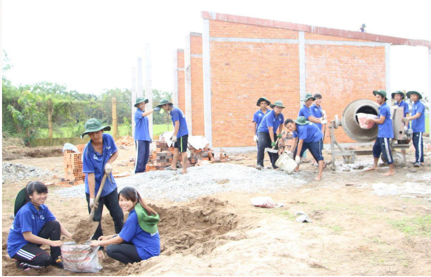
Sinh viên Khoa Công nghệ xây nhà công vụ tại Trường tiểu học An Hòa 3.

Song song với việc làm tình nguyện tại đây thì các bạn sinh viên còn có cơ hội trau dồi kiến thức chuyên ngành. Được biết, hè tình nguyện lần này cũng là môn thực tập lấy điểm trên lớp của các bạn sinh viên ngành Xây dựng cầu đường, khóa 37. Đồng hành với khoa Công nghệ tại khu Hòa An còn có các chiến sĩ của Khoa Phát triển Nông thôn và Khoa Môi trường đang cố gắng hoàn thành nhiệm vụ hoàn thiện tuyến đường dài 1,1 km cho bà con ấp Xẻo Trâm.