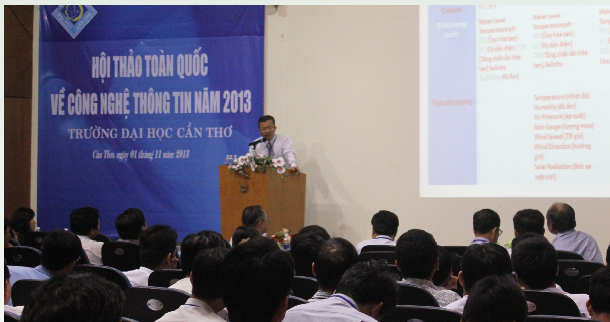
Hội thảo toàn quốc về Công nghệ Thông tin năm 2013 do Khoa tổ chức.

N ghiên cứu khoa học (NCKH) là một trong những công tác quan trọng được Khoa CNTT&TT thực hiện thường xuyên qua việc tham dự và tổ chức các seminar, hội thảo khoa học trong và ngoài nước. Trong năm, Khoa đã thực hiện được 38 seminar và có 38 bài báo đăng trong các kỷ yếu hội thảo trong nước, 22 bài đăng trên các tạp chí và kỷ yếu hội thảo quốc tế. Khoa đang triển khai thực hiện 02 đề tài hợp tác quốc tế (01 trong dự án JEAL-DREAM, 01 trong khuôn khổ của AUF), 02 đề tài nghiên cứu khoa học cấp Tỉnh, 01 đề tài cấp Bộ đã được đưa vào danh sách mời thầu thực hiện, 06 đề tài cấp Trường.