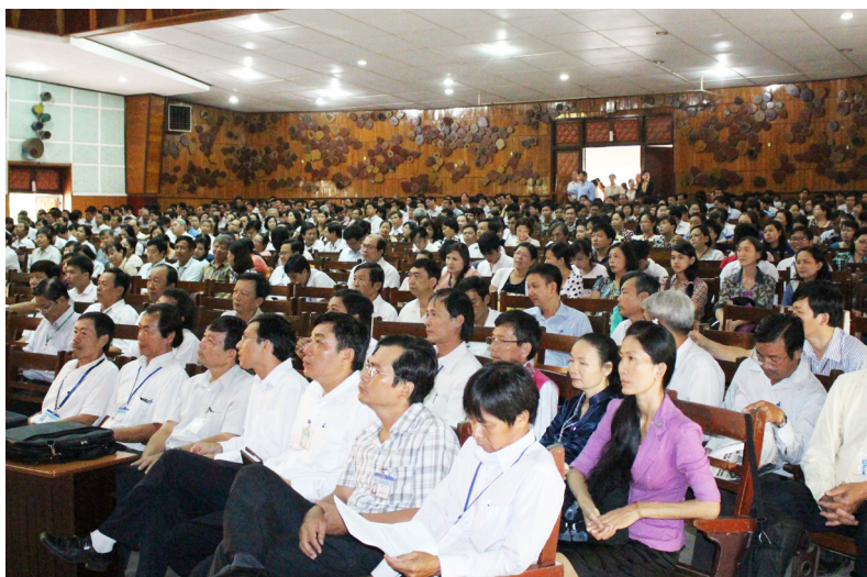
CCVC dự buổi họp mặt đầu năm học mới 2014-2015 tại Hội trường Lớn.

Nhân dịp này, đại diện Ban Chấp hành Công đoàn và Đoàn Thanh niên Trường cũng tiến hành báo cáo tổng kết hoạt động Công đoàn và Đoàn Thanh niên trong năm học 2013-2014 và chương trình hành động trong năm học mới. Trong đó, Công đoàn Trường sẽ tập trung vào các hoạt động hỗ trợ nâng cao hiệu quả hoạt động đào tạo; góp phần nâng cao đời sống CCVC; thực hiện nghị quyết của Công đoàn cấp trên về đổi mới, nâng cao chất lượng đào tạo; thực hiện các hoạt động xã hội, từ thiện của Trường. Đoàn Thanh niên Trường sẽ nỗ lực hỗ trợ sinh viên thực hiện các hoạt động học tập và rèn luyện, đặc biệt là bồi dưỡng những kỹ năng cần thiết để sinh viên hội nhập quốc tế với tinh thần sẵn sàng hội nhập Cộng đồng ASEAN vào năm 2015.