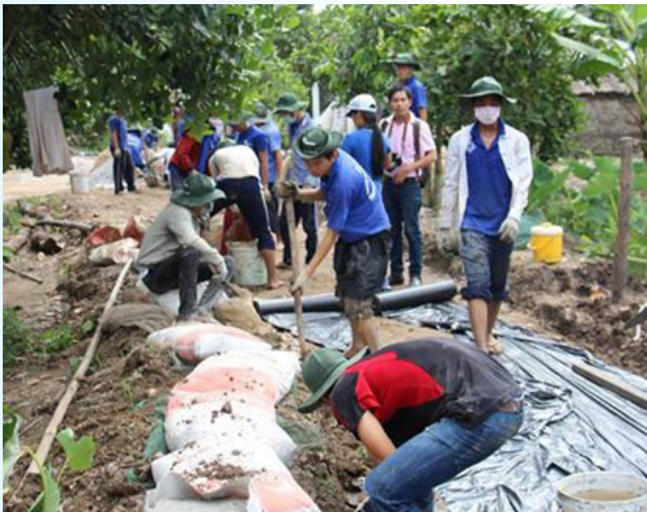
Xây dựng tuyến đường dài 1,1 km cho bà con ấp Xẻo Trâm.

Tại khu Hòa An của Trường Đại học Cần Thơ, các chiến sĩ tình nguyện Khoa Công nghệ đang cố gắng hoàn thành 02 nhà công vụ tại trường Tiểu học An Hòa 3 và 02 cây cầu tại ấp Xẻo Trâm, xã Hoà An, huyện Phụng Hiệp, tỉnh Hậu Giang, giúp cho bà con sinh hoạt đi lại thuận tiện hơn.