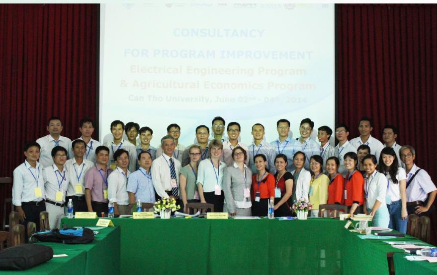
Ảnh lưu niệm tại Hội thảo.

A SEAN-QAAct là một hoạt động mở rộng của khuôn khổ Dự án hợp tác DIES ASEAN-QA giai đoạn 1 dành cho tất cả 21 trường đại học đã được đánh giá ngoài theo tiêu chuẩn chất lượng AUN-QA. Tuy nhiên, Dự án chỉ chọn 06 trường để tư vấn cải tiến và Trường Đại học Cần Thơ (ĐHCT) là một trong 06 trường được chọn để thực hiện tư vấn cải tiến sau đánh giá. Vì vậy, Hội thảo “ Tư vấn cải tiến về chuẩn đầu ra, chiến lược giảng dạy-học tập và phương pháp đánh giá sinh viên cho hai chương trình đào tạo Kỹ thuật điện-Điện tử và Kinh tế Nông nghiệp ” đã diễn ra tại Trường ĐHCT từ ngày 02/6/2014 đến ngày 04/6/2014 tại Hội trường Khoa Kinh tế và Quản trị Kinh doanh (KT & QTKD).