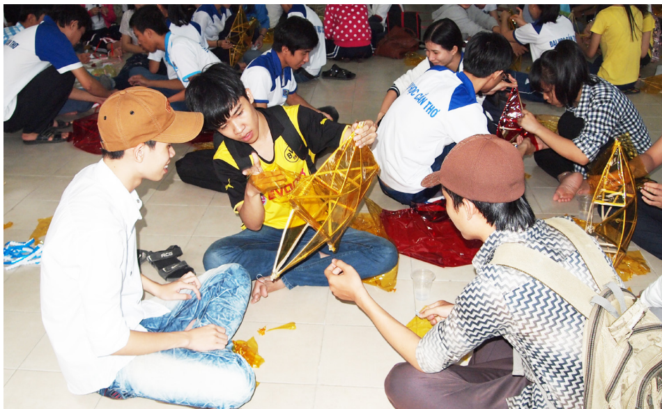
Sinh viên Khoa Công nghệ làm 300 chiếc lồng đèn để gửi tặng các em thiếu nhi có hoàn cảnh khó khăn.