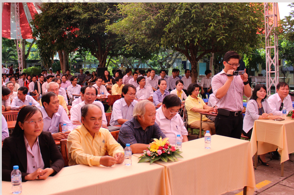
Các đại biểu tham dự lễ kỷ niệm.

viên đã đóng góp, tài trợ cho chương trình Kỷ niệm 20 năm thành lập Khoa, hỗ trợ các suất học bổng rất có ý nghĩa đối với các em sinh viên có hoàn cảnh khó khăn vươn lên học tốt, cũng như đồng hành cùng các em trong các chương trình tập huấn kỹ năng xã hội, tư vấn hướng nghiệp và tuyển dụng.