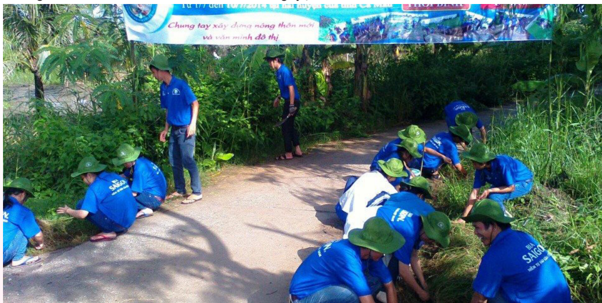
Các chiến sĩ tình nguyện phát quang bụi rậm tại 2 huyện Thới Bình và U Minh.