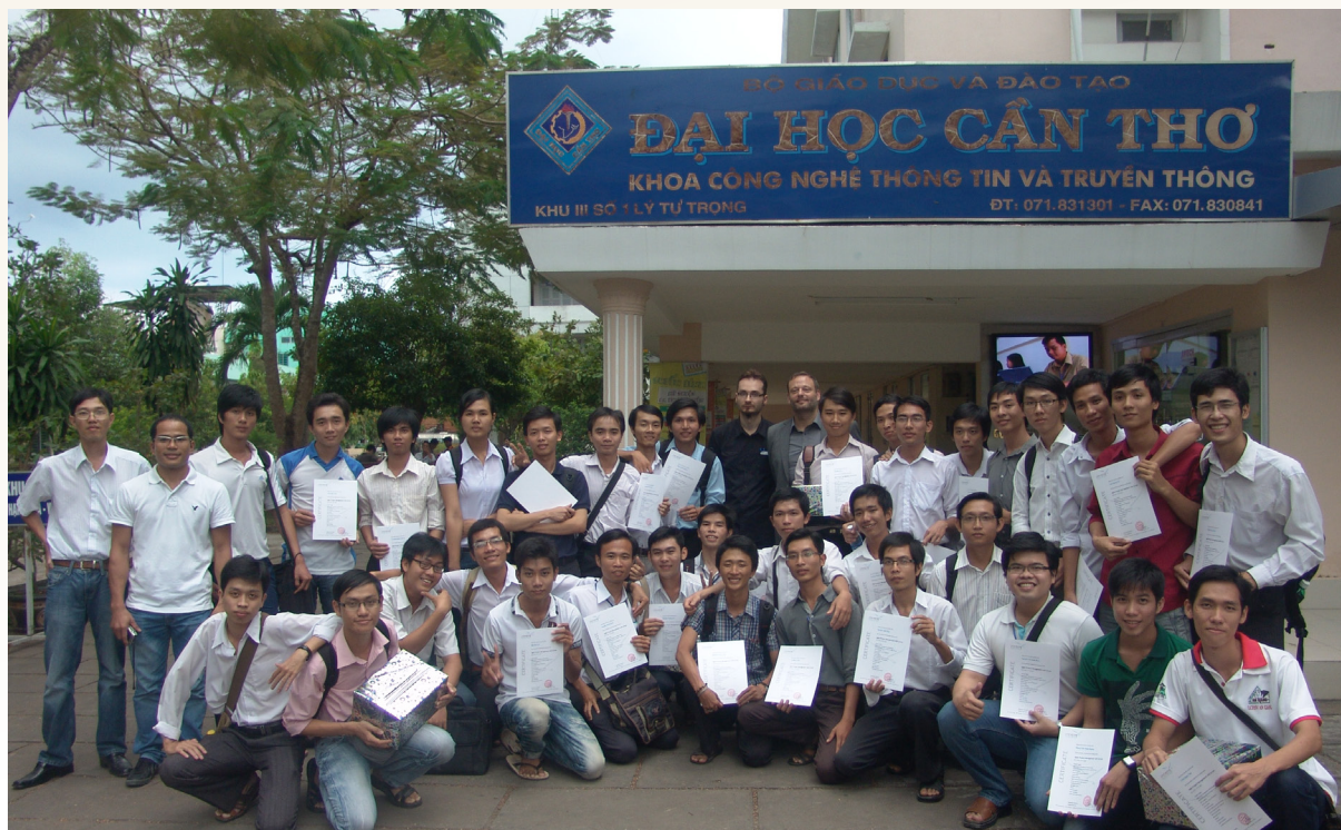
Ảnh lưu niệm giữa sinh viên Khoa và chuyên gia quốc tế.